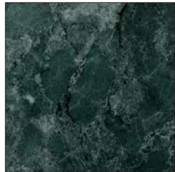
床 IS1077 [サンゲツ]