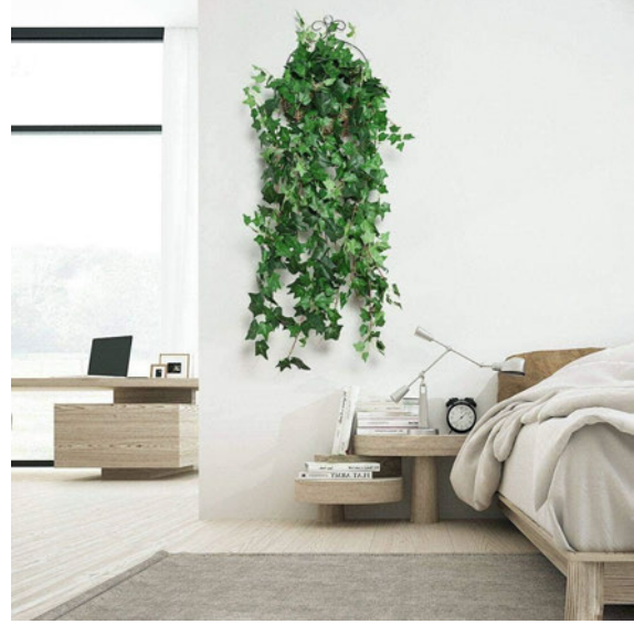
フェイクグリーン